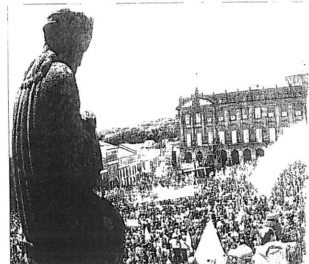
A manifestación ategou a praza do Obradoiro de Compostela. Logo dun percorrido pr...