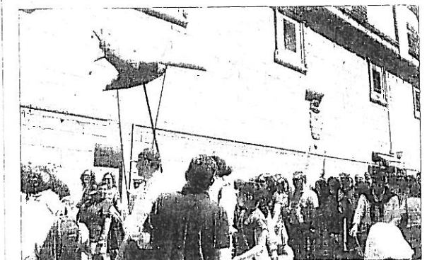
A Galiña Azul 'sobrevotou' as rúas compostelas