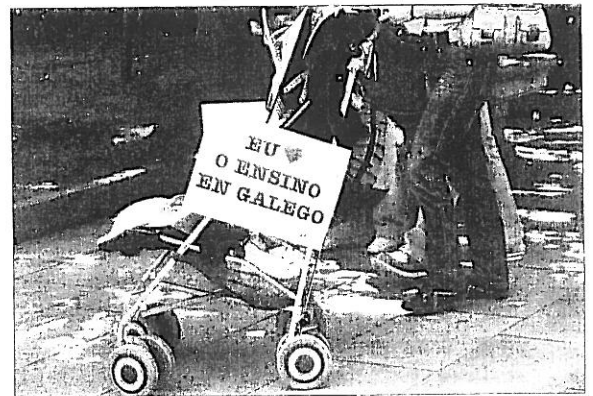
A pancarta máis vista. 'Eu amo o ensino en galego'

Un palco recibía os manifestantes no Obradoiro. Alí incluso houbo algúns turistas que se uniron á mobilización. Para iso, os 'animado-