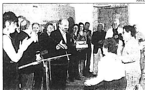
Un dos momentos do acto de entrega dos premios da AELG 2010.