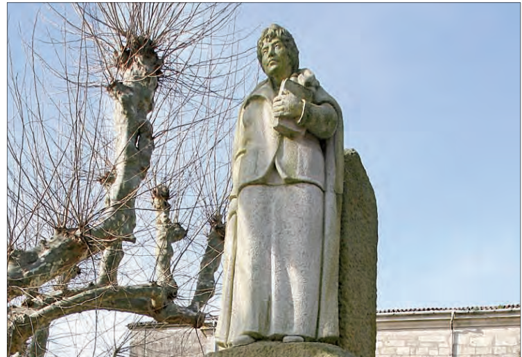
Monumento a Rosalía de Castro no Espolón de Padrón

Durante estes anos de estreita relación con Abuín, amosoume sempre o seu interese pola defensa da lingua galega, a súa preocupación polo asoballamento que sufría por parte dos castelán falantes e, tamén como non, polos reintegracionistas ou partidarios do lusismo dos que el non era partidario, como así o testemuñan algúns artigos e controversias cos lusistas que tiveron amplo eco na prensa escrita a finais da década dos setenta. Pero, por riba de todo, estaba a adoración e admiración que