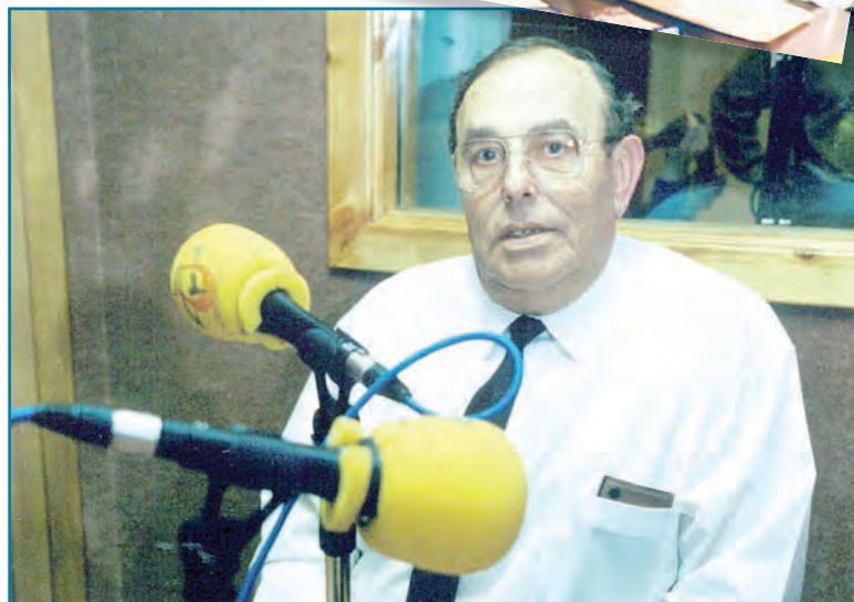
Abuín de Tembra dirixiu programas, en distintas emisoras de radio, realizados para difundir o labor das bandas de música