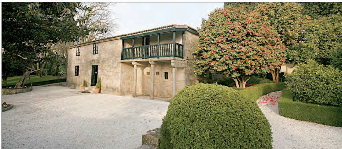
Casa Museo de Rosalía de Castro en Padrón

e lembrado noso amigo que, dende o fondo do seu espírito valente, se caracterizou, como poucos, polo seu inquebrantábel teísmo silente e pola súa irrenunciábel entrega a Galicia. Amou a fermosa fala xurdida do noso pobo e expresouse e viviu nela como a mellor maneira de sentir e de manifestar a súa fe cristiá, entendida como solidariedade e crenza interior, e a súa pacífica, decidida e continua loita cultural pola patria galega.