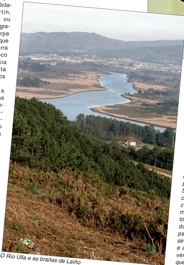
O Río Ulla e as brañas de Laiño