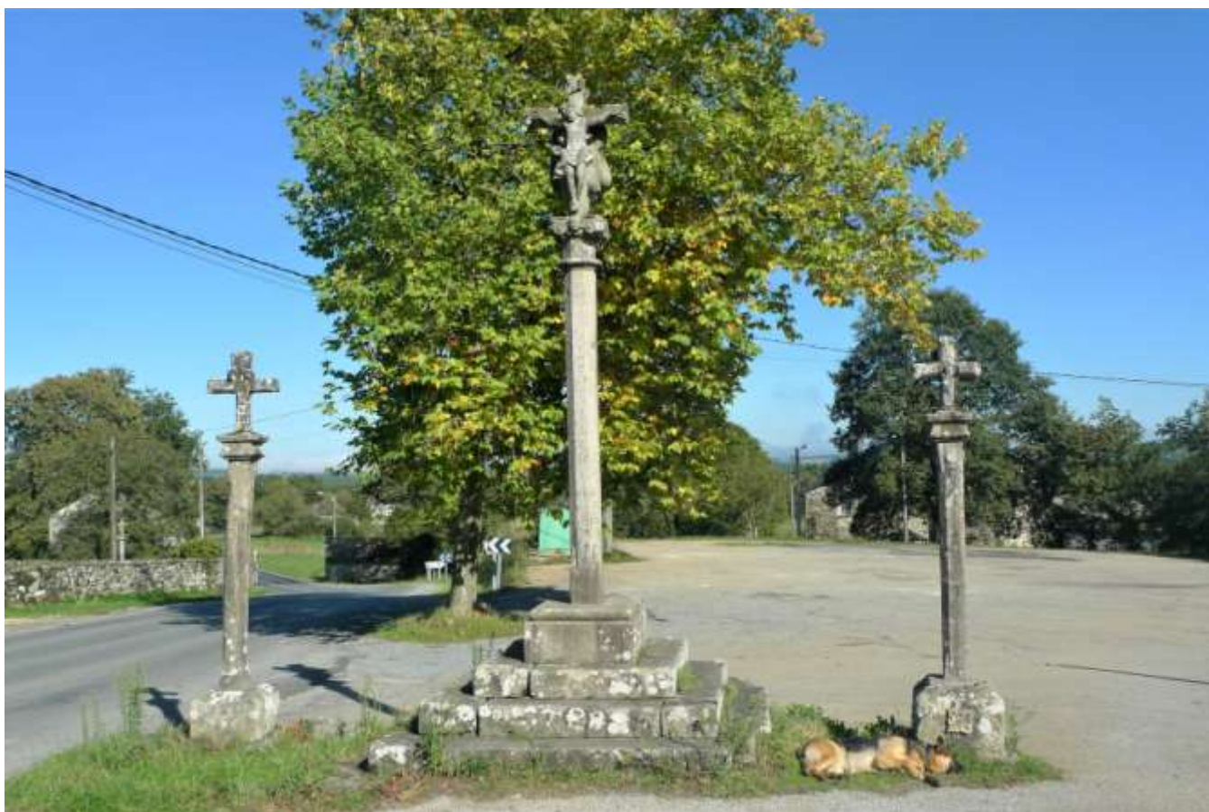
FOTO Nº 27. CALVARIO DOS VILARES