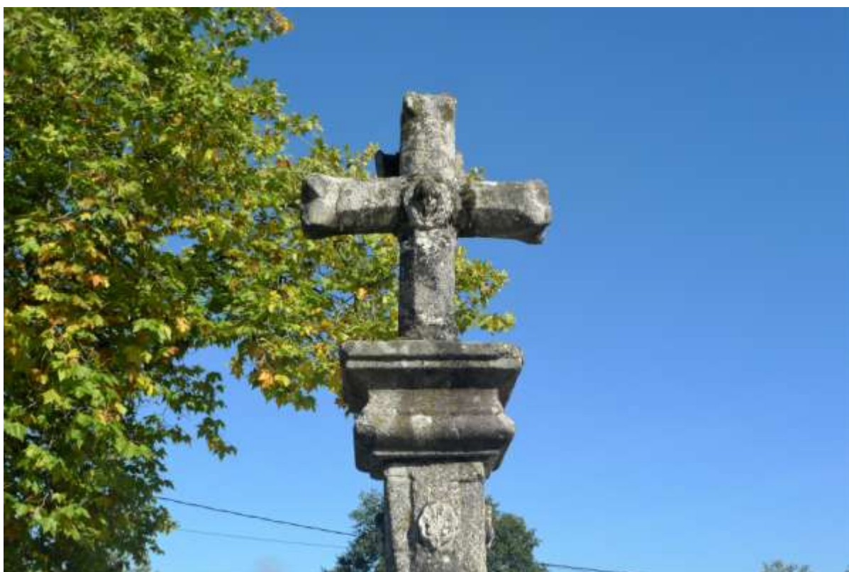
FOTO Nº 22. CALVARIO DOS VILARES. CRUCEIRO LATERAL ESQUERDO