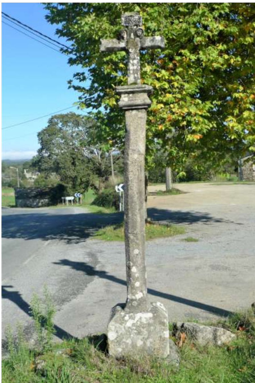
FOTO Nº 26. CALVARIO DOS VILARES. CRUCEIRO LATERAL DEREITO