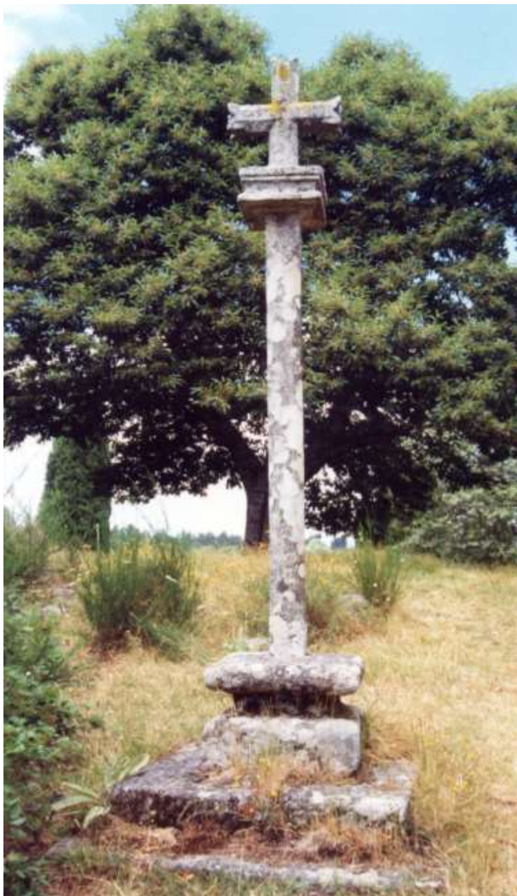
FOTO Nº 14. CRUCEIRO DE SAN SALVADOR DE PARGA