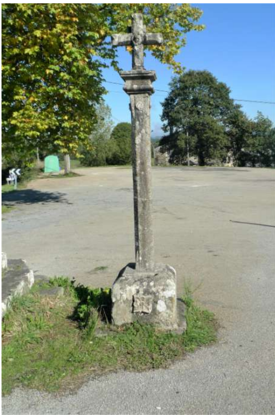
FOTO Nº 21. CALVARIO DOS VILARES. CRUCEIRO LATERAL ESQUERDO