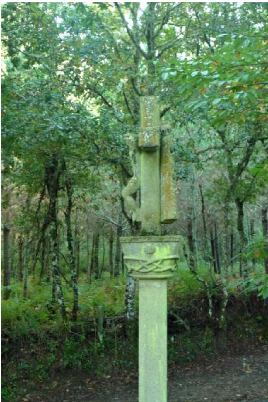
FOTO Nº 25. CRUCEIRO DO SAN ALBERTE. DETALLE.