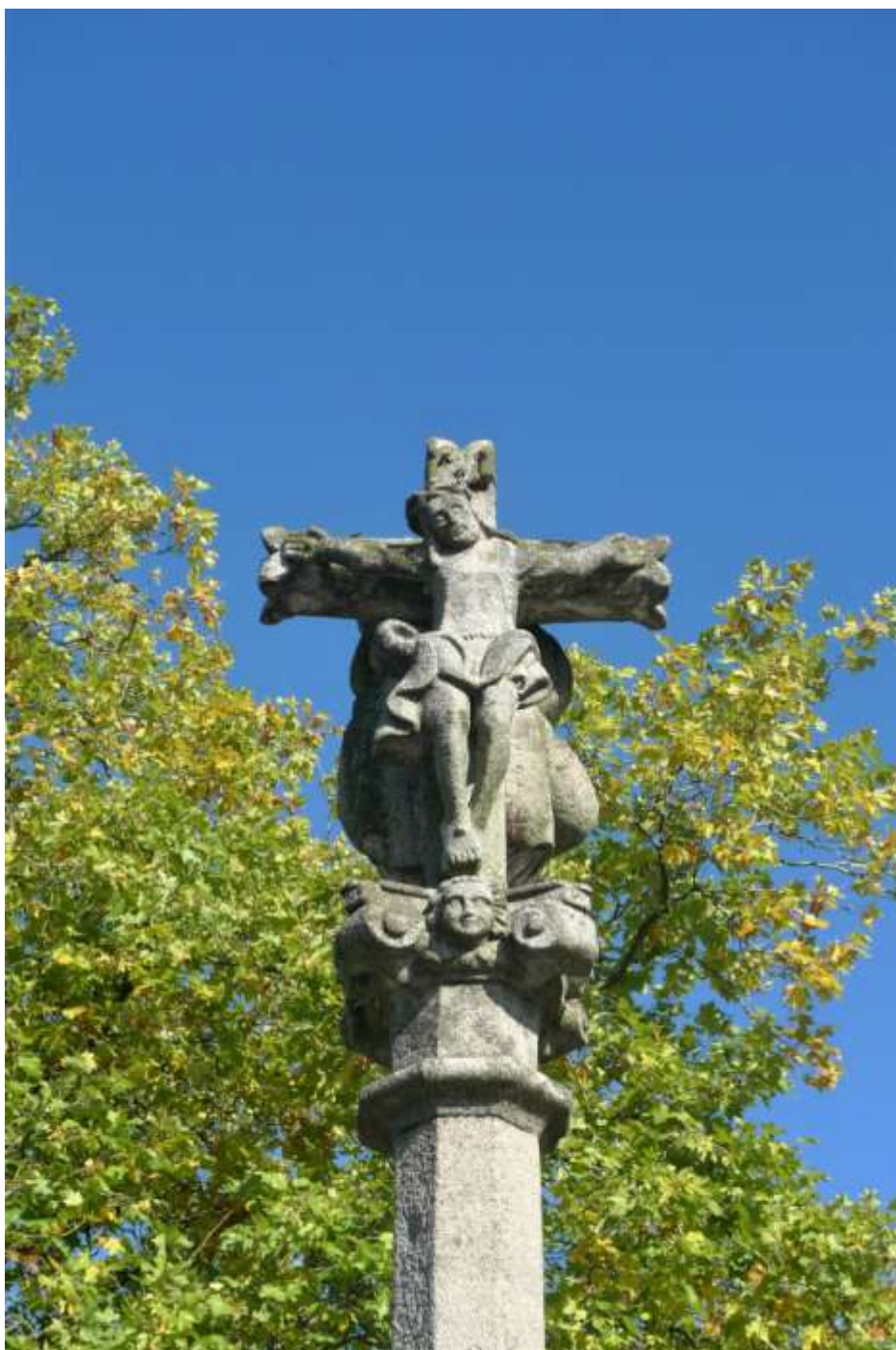
FOTO Nº 23. CALVARIO DOS VILARES. DETALLE CRUCEIRO CENTRAL