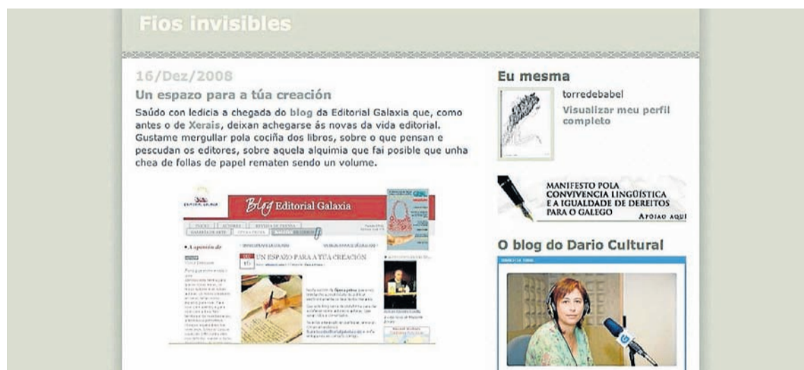
Captura do blog Fíos invisibles da xarxentino-galega Débora Campos

información que fornece resulta máis ca suficiente.