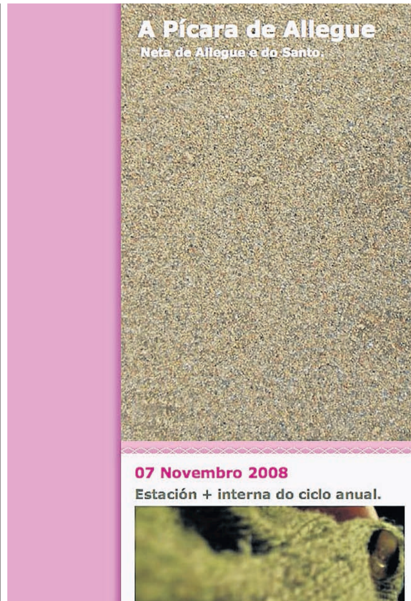
A Pícara de Allegue Neta de Allegue e do Santo.